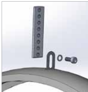
図1：フェンダーのブラケットをフェンダーフルートが一番下の穴に取り付けます